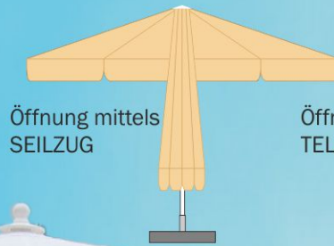
Öffnung mittels SEILZUG

Grössere und schwerere Ausführungen auf Anfrage