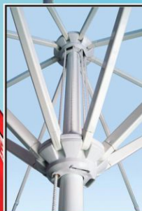
Seilzug mit Seilstopper

Bei unseren Schirmen sind die Bespannungen abnehmbar und Bauteile einzeln austauschbar.